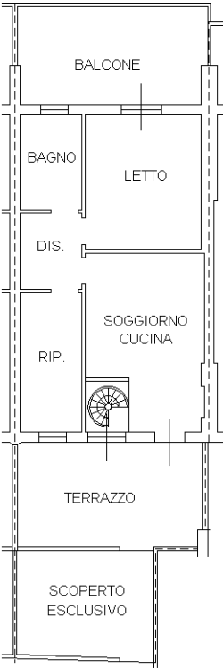
PIANO TERRA (H. 2,70)